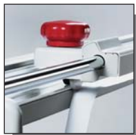
Tête de coupe coulissante