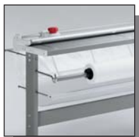
Porte-rouleau de papier